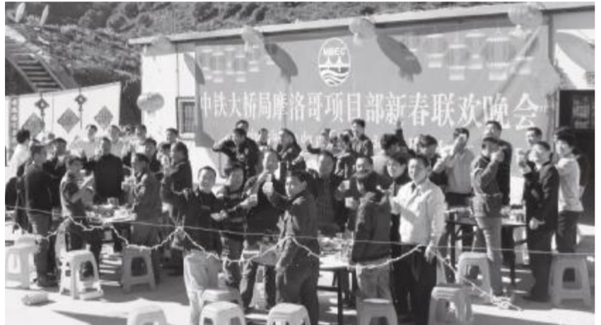
在六公司摩洛哥格利格河谷斜拉桥项目部,员工们举杯共庆新年。

当地的朋友还送来了大大的蛋糕,上面特意做了大桥局的局徽,分别用中文与法文写上“新年快乐”。 大年初一放假一天,项目部组织部分人员外出到非洲最北部的城市丹吉尔放松一下,神秘的摩洛哥“非洲之洞”、精美的当地工艺品与石器、浩瀚的大西洋、直布罗陀海峡、帕斯角灯塔,使大家心胸变得开阔起来,身心彻底地得到了放松。 拉巴特环城高速公路格利格河谷斜拉桥由六公司承建,是摩洛哥王国第一座斜拉桥,建成后将成为摩洛哥乃至非洲的标志性建筑。