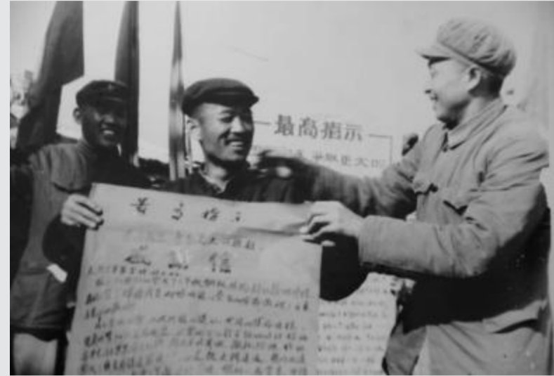
1971年9月26日,福建乌龙江大桥建成通车。此时正处于文革时期,当地革委会的军代表,敲锣打鼓地给参加桥梁建设的“大桥3号吊”,送来用大红纸写的感谢信,这在当时是对参建者最高的表彰形式。感谢信的信头上附有“最高指示”,带有那个时代的鲜明印记。 乌龙江大桥位于福州市乌龙江下游峡口处,是新中国较早建成的一座大跨度预应力混凝土刚构桥,是福厦公路的重要桥梁之一。 大桥修建前,福厦公路几十年都是依靠轮渡接渡车辆。大桥建成后,过往的汽车不再需要轮渡,直到如今,这座大桥仍为福厦公路提供服务。 高 武 供图 配文